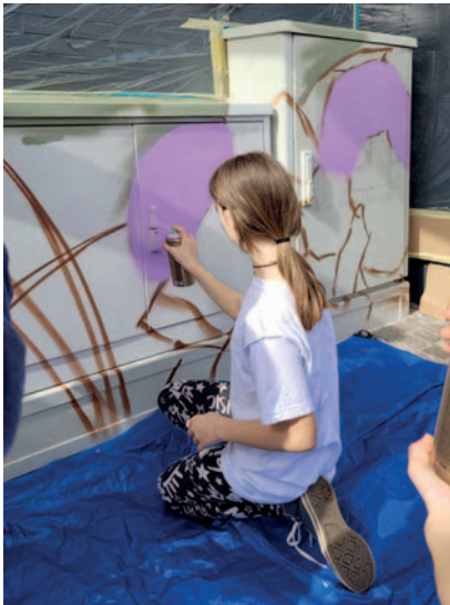
Einfach mal trauen: Die Mädchen und Jungen vom Jugendtreff durften beim Graffiti-Projekt mit anpacken.

Sie strahlen mit der Sonne um die Wette – drei Mädchen und vier Jungen vom Jugendtreff im Alter zwischen 9 und 18 Jahren dürfen an einem sonnigen Tag im April eine Reihe von Stromverteilerkästen auf dem Schillerplatz mit Graffitis verzieren. Zwei Künstler von Wandkunst Speyer unterstützen die Kinder und Jugendlichen, zeichnen die Konturen vor und kümmern sich um den letzten Schliff. So entsteht innerhalb weniger Stunden ein farbenprächtiges Kunstwerk.