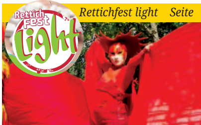
Rettichfest light Seite

Laufadrennen, Rettichfestlauf und Public Viewing zur EM - das Rettichfest light vom 14. bis zum 16. Juni lockt mit einem vielseitigen Programm ins Grüne an die Waldfesthalle. Auch eine neue Hoheit wird gekrönt: Rettichkönigin Jessica I.