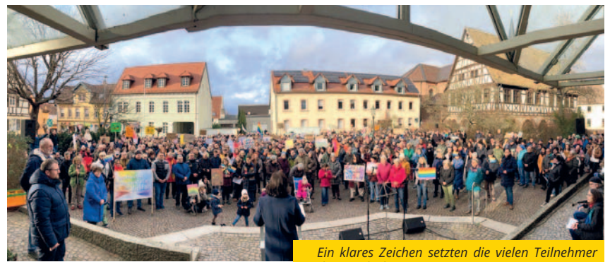
Ein klares Zeichen setzen die vielen Teilnehmer der Kundgebung.

Fotocollage ist ein Zeichen, wie bunt und vielfältig Schifferstadt ist. 2013 und 2015 organisierte die Gruppe eine Gegenkundgebung anlässlich des Aufmarschs der NPD. Jährlich organisiert das Bündnis in Zusammenarbeit mit der Stadtverwaltung eine abwechslungsreiche Veranstaltungsreihe im November zum Gedenken an jüdisches Leben, mit Lesungen, Ausstellungen, Konzerten und Vorträgen.