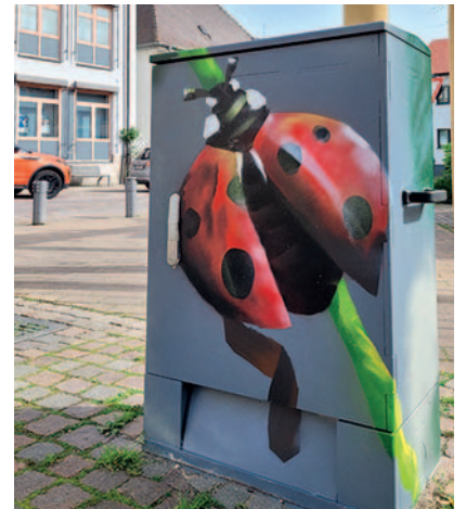
Sommerlich: Die Graffiti-Künstler von Wandkunst Speyer haben einen Marienkäfer auf einen der Stromkästen gesprayt.