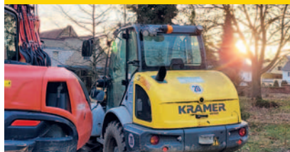
Soziale Stadt Seite 8+9

Ein Förderbescheid von über 1,6 Millionen Euro sorgt im Gebiet der Sozialen Stadt für große Veränderungen: Die Hauptstraße wird aufgewertet und die Umbauarbeiten zum Stadtpark an der Mannheimer Straße haben begonnen.