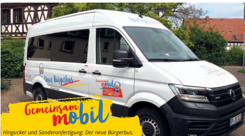
Hingucker und Sonderanfertigung: Der neue Bürgerbus.

Der Bürgerbus Schifferstadt ist ein wichtiges und zentrales Element für Menschen mit eingeschränkter Mobilität, durch das die Teilhabe und die Selbstständigkeit im Lebensalltag erhalten werden kann. Im März ist das neue E-Fahrzeug eingetroffen, auf das sich insbesondere das Team des Bürgerbus lange gefreut hat. Eine Sonderanfertigung, bei der auch die Wünsche des Bürgerbus-Teams berücksichtigt wurden, macht den kostenlosen