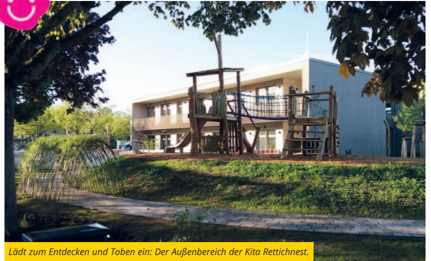
Lädt zum Entdecken und Toben ein: Der Außenbereich der Kita Rettichnest.

Die Bauarbeiten sind fast abgeschlossen, bis spätestens Ende Mai sollte auch der Rasen auf dem Außengelände angewachsen sein. Neben einer Eröffnungsfeier ist dann auch ein Tag der offenen Tür für das zweite Halbjahr angedacht. Interessierte Eltern können sich jederzeit telefonisch unter 06235 - 491430 oder per E-Mail an kita.rettichnest@schifferstadt.de melden. Für kleinere Gruppen wird es neben dem Tag der offenen Tür auch Besichtigungstermine geben.