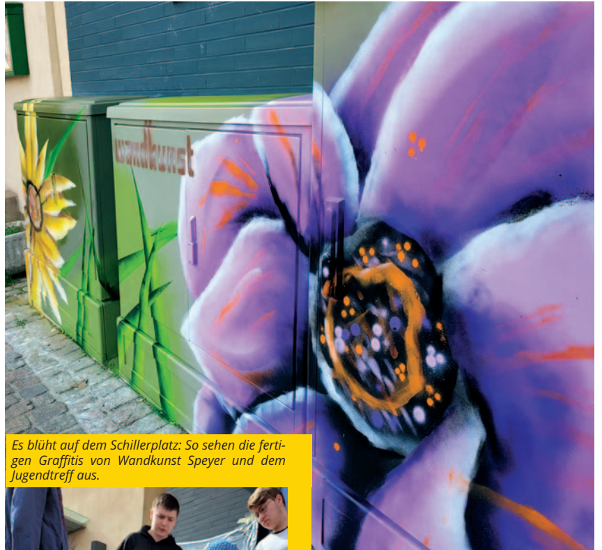
Es blüht auf dem Schillerplatz: So sehen die fertigen Graffitis von Wandkunst Speyer und dem Jugendtreff aus.

Sie haben auch eine Idee, um das Leben in Schifferstadt schöner, nachhaltiger und bunter zu machen? Mithilfe des Verfügungsfonds können Sie bis zu 2.000 Euro für Ihr Projekt im Gebiet der Sozialen Stadt erhalten. Weitere Informationen finden Sie auf der städtischen Homepage www.schifferstadt.de .