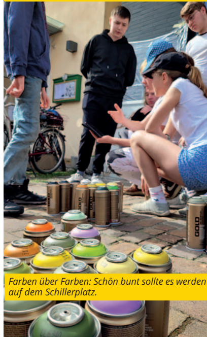
Farben über Farben: Schön bunt sollte es werden auf dem Schillerplatz.