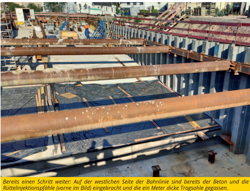
Bereits einen Schritt weiter: Auf der westlichen Seite der Bahnlinie sind bereits der Beton und die Rüttelinjektionspfähle (vorne im Bild) eingebracht und die ein Meter dicke Trogsohle gegossen.

„185 Meter lang, zwischen 12 und 14 Meter breit und in 20 Einzelblöcke unterteilt - die Baustelle zur Bahnunterführung in der Iggelheimer Straße ist auch für die Ingenieure vor Ort kein alltägliches Projekt“, erklärt der zuständige Projekt-Ingenieur Ingo Schneider. Mit Warnweste und Bauhelm ausgestattet, gestattet er einen Rundgang über die Baustelle und gibt Informationen zum aktuellen Zwischenstand. Vor knapp 1,5 Jahren begannen die Bauarbeiten für eine Bahnunterführung in der Iggelheimer Straße, denen eine jahrzehntelange Planung voraus ging. Die Havarie im Oktober 2023, bei der der Einsturz der Baugrube drohte, warf den Zeitplan und den Ablaufplan durcheinander, doch die Arbeiten gehen gut voran.