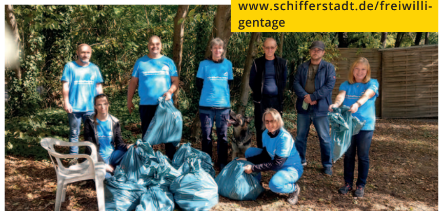
Erfolgreiche Müllsammel-Aktion des Vereins der Hundefreunde im Jahr 2020: zehn Säcke voller Glascherben und Plastik kamen zusammen.

stadtmarketing@schifferstadt.de Tel. 06235 - 44129 www.schifferstadt.de/freiwilligentage