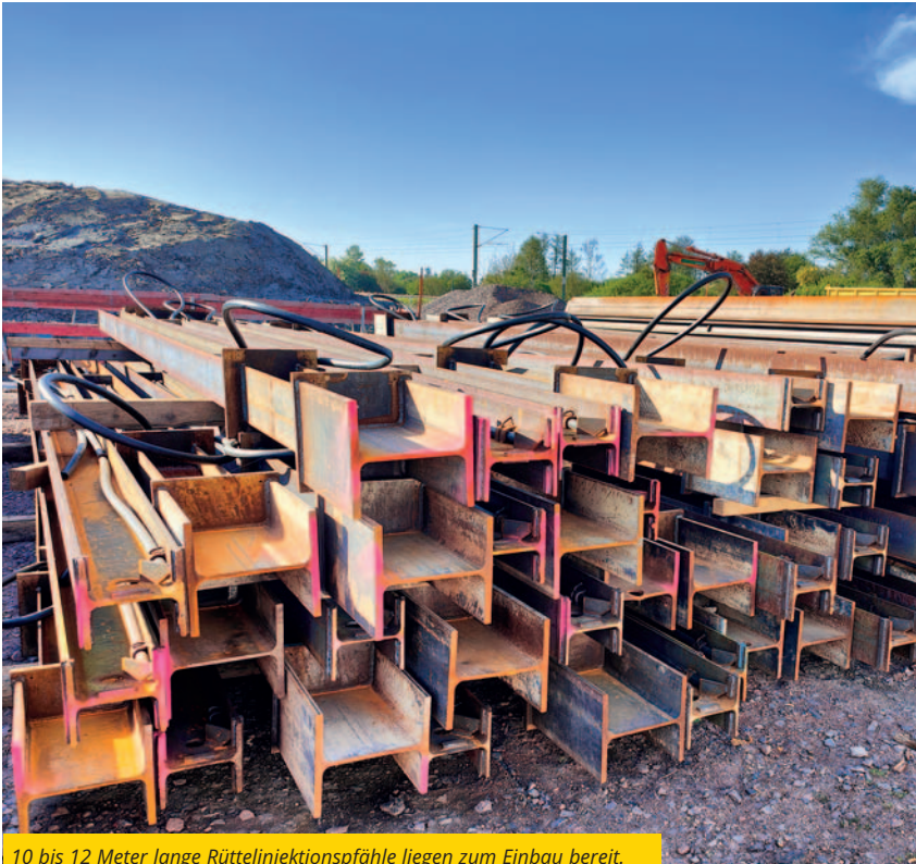
10 bis 12 Meter lange Rüttelinjektionspfähle liegen zum Einbau bereit.