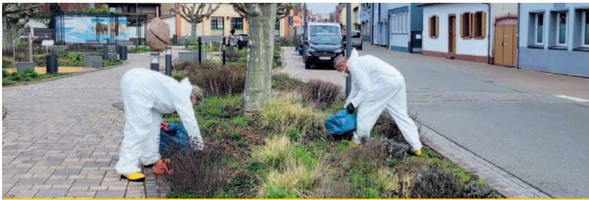
Nicht nur eklig, sondern potenziell auch gesundheitsgefährdend: Die Mitarbeiterinnen und Mitarbeiter der Stadtgärtnerei entfernen den Hundekot am Kreuzplatz in Schutzkleidung.

Ausgestattet mit Masken und Ganzkörperschutzanzügen stapfen sie durch die Beete - was wie ein Katastrophenszenario anmutet, ist ein regelmäßiger Arbeitseinsatz für die Mitarbeiterinnen und Mitarbeiter der Stadtgärtnerei, bevor sie mit der eigentlichen Pflanzenpflege beginnen können. Der Grund für die Schutzkleidung ist Hundekot oder eher: die potentiell gesundheits-schädliche Gefahr, die von den Hinterlassenschaften der Vierbeiner ausgeht.