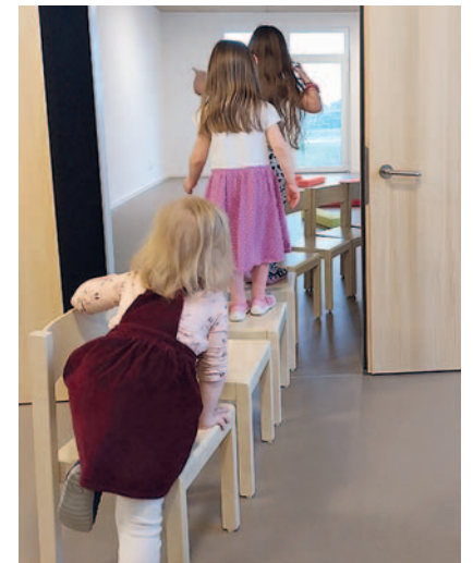
Finden spielerisch den Weg in die Kita: Bald besuchen 80 Kinder das Rettichnest.