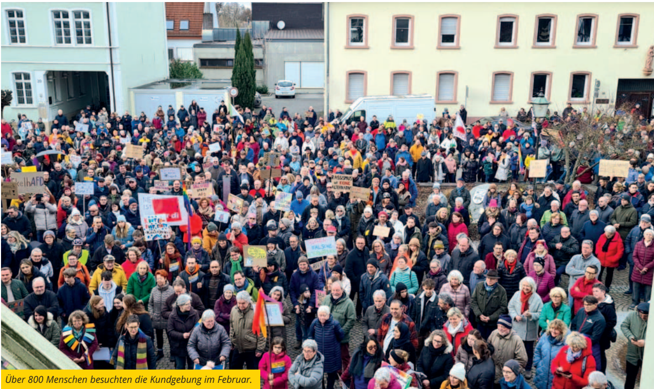
Über 800 Menschen besuchten die Kundgebung im Februar.

Von Kundgebungen, über Gedenkveranstaltungen an jüdisches Leben in unserer Stadt bis hin zu Mahnwachen und einer bunten Fotoaktion – das Bündnis für Demokratie und Toleranz, in dem sich rund 40 Menschen aus verschiedenen Schifferstadter Gruppierungen und Privatpersonen engagieren, setzt ein kraftvolles Zeichen für eine bunte und tolerante Stadt.