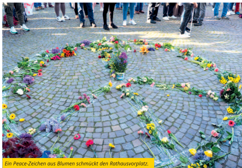
Ein Peace-Zeichen aus Blumen schmückt den Rathausvorplatz.

Mit der Aktion „Gesicht zeigen für Demokratie und Vielfalt“ spricht die Stadtverwaltung gemeinsam mit dem Bündnis alle Bürgerinnen und Bürger und Gäste der städtischen Veranstaltungen an, mit dem eigenen Gesicht für Demokratie und Vielfalt einzustehen. Die farbenfrohe