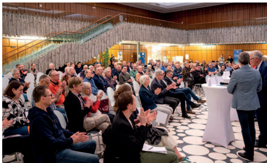
Unter Einbezug der Öffentlichkeit: Informationsabend in Schifferstadt im April.