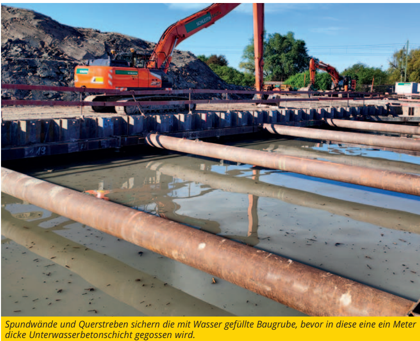
Spundwände und Querstreben sichern die mit Wasser gefüllte Baugrube, bevor in diese eine ein Meter dicke Unterwasserbetonschicht gegossen wird.