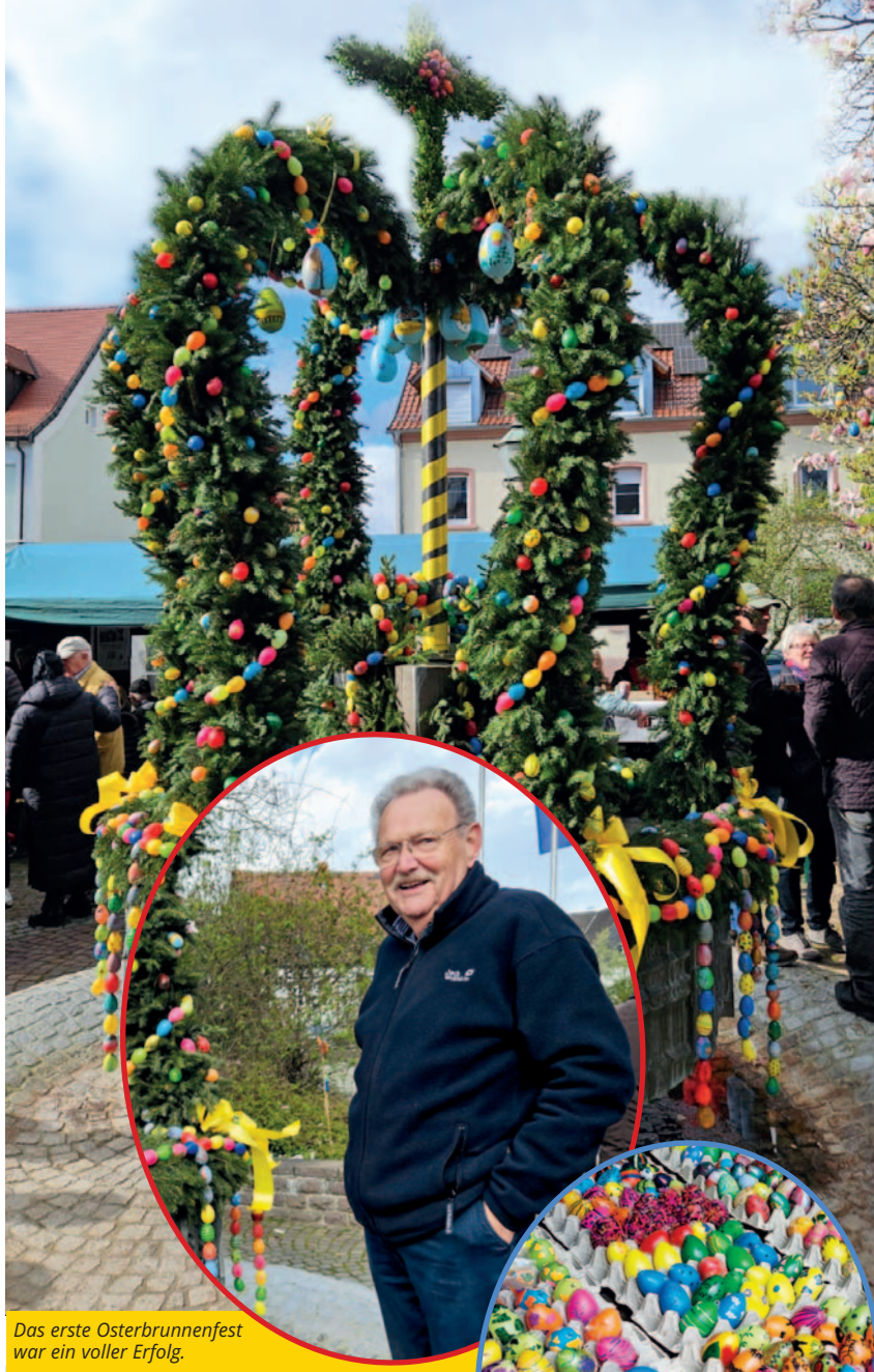
Das erste Osterbrunnenfest war ein voller Erfolg.

Die unglaubliche Menge von 2.500 bunten Eiern, ein zwei Meter hohes Metallgestänge, umwickelt mit Tannenzweigen und unzählige Stunden Arbeit verwandelten den Brunnen vor dem Rathaus pünktlich zu Palmsonntag in einen prächtigen Osterbrunnen. Der Verein der Garten- und Blumenfreunde lud gemeinsam mit der Stadtverwaltung zu einem bunten Fest rund um den Brunnen auf dem Rathausvorplatz ein. 500 der bunten Eier wurden von Vereinen, Kindertagesstätten und Privatpersonen liebevoll bemalt. Fröhliche Osterlieder, gesungen von den Kindern der Kita Herz Jesu, leckeres Essen und kühle Getränke stimmten alle Gäste auf das Osterfest ein.