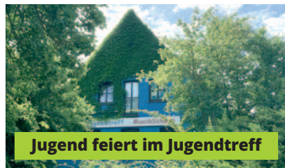
Jugend feiert im Jugendtreff

„Es war uns wichtig, dass sich Rettichfesteröffnung und Fußball-EM nicht ausschließen, so dass wir hier eine Lösung erarbeitet haben, um alle Interessen zu vereinen“, so die Organisatoren des Fests. Mittels großer Leinwand wird das Fußballerlebnis in der Halle zu sehen sein.