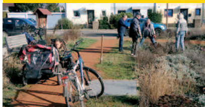
Unsere Grünflächen Seite 7

Blütenstauden und Steppenpflanzen besiedeln die über 600 m 2 große Grünfläche an der Ecke Breslauer / Mannheimer Straße. Wie aus der kahlen Betonplatte eine farbenfrohe Bienenweide wurde, lesen Sie auf Seite 7.